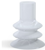
Référence déclinaison : 88B 40SLT A