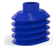
Référence déclinaison : 4PA56 38 50SLBLEU A