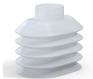
Référence déclinaison : 4PA56 38 50SLT A