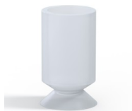
Référence déclinaison : 73 19SLT A