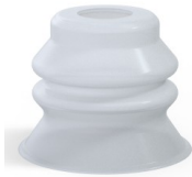
Référence déclinaison :