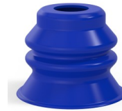
Référence déclinaison :