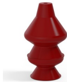
Référence déclinaison : 81 30SL A