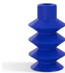
Référence déclinaison : 81 14SLBLEU A