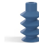
Référence déclinaison : 81 14SLBLEU A SH30