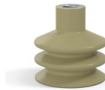
Référence déclinaison : 8B 50CN F14