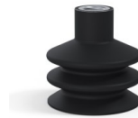
Référence déclinaison : 8B 50NI F14