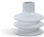
Référence déclinaison : 8B 50SLT F14