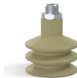
Référence déclinaison : 8B 50CN M14