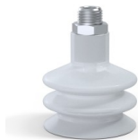
Référence déclinaison : 8B 50SLT M14