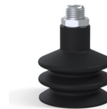
Référence déclinaison : 8B 50NI M14