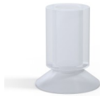
Référence déclinaison : 76 17SLT A SH40