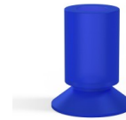
Référence déclinaison : 76 17VI A