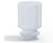
Référence déclinaison : 1 05SLT A