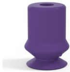
Référence déclinaison : 1 10MNT A