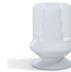
Référence déclinaison : 1 10SLT A