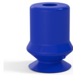
Référence déclinaison : 1 10PU A