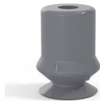
Référence déclinaison : 1 10NR A