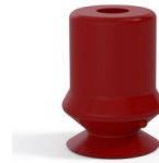
Référence déclinaison : 1 10SL A