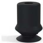
Référence déclinaison : 1 10NI A