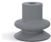
Référence déclinaison : 1 18NR A