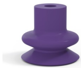
Référence déclinaison : 1 18MNT A