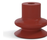
Référence déclinaison : 1 18SL A