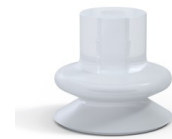
Référence déclinaison : 1 18SLT A