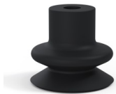
Référence déclinaison : 1 18NI A