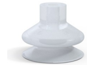
Référence déclinaison : 1 23SLT A