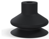
Référence déclinaison : 1 23NI A