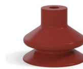
Référence déclinaison : 1 23SL A