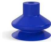
Référence déclinaison : 1 23PU A