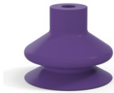
Référence déclinaison : 1 23MNT A