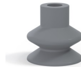
Référence déclinaison : 1 27NR A