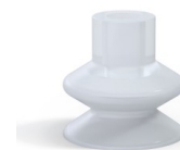
Référence déclinaison : 1 27SLT A