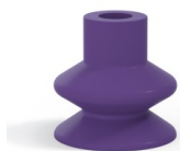
Référence déclinaison : 1 27MNT A