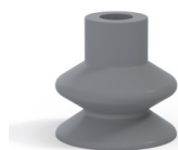
Référence déclinaison : 1 27NR A