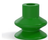
Référence déclinaison : 1 27SLV A