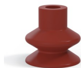
Référence déclinaison : 1 27SL A