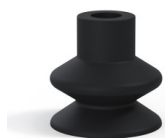
Référence déclinaison : 1 27NI A