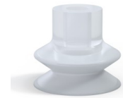
Référence déclinaison : 1 32SLT A