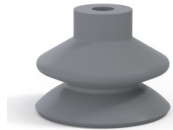
Référence déclinaison : 1 42NR A