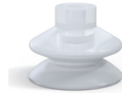
Référence déclinaison : 1 42SLT A