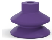
Référence déclinaison : 1 42MNT A