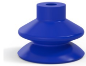
Référence déclinaison : 1 42PU A