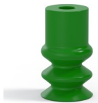
Référence déclinaison : 2 12SLV A