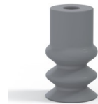
Référence déclinaison : 2 12NR A