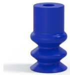
Référence déclinaison : 2 12PU A