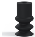
Référence déclinaison : 2 12NI A