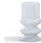
Référence déclinaison : 2 12SLT A