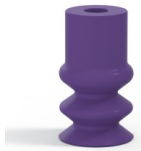
Référence déclinaison : 2 12MNT A