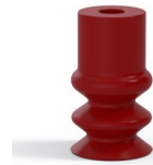
Référence déclinaison : 2 12SL A