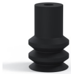
Référence déclinaison : 2 16NI A