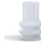
Référence déclinaison : 2 16SLT A