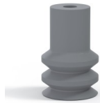
Référence déclinaison : 2 16NR A