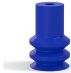
Référence déclinaison : 2 16PU A