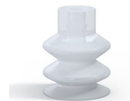
Référence déclinaison : 2 18SLT A