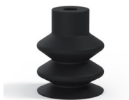
Référence déclinaison : 2 18NI A