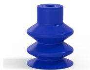
Référence déclinaison : 2 18PU A