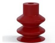
Référence déclinaison : 2 18SL A