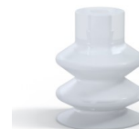
Référence déclinaison : 2 18SLT A