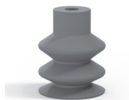
Référence déclinaison : 2 18NR A