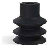
Référence déclinaison : 2 31NI A