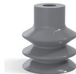
Référence déclinaison : 2 31NR A