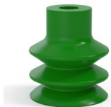
Référence déclinaison : 2 31SLV A