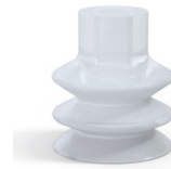
Référence déclinaison : 2 31SLT A