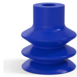
Référence déclinaison : 2 31PU A