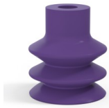
Référence déclinaison : 2 31MNT A