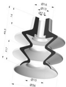
Référence déclinaison : 2 36CN A