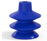
Référence déclinaison : 2 36PU A