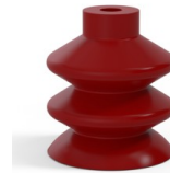
Référence déclinaison : 2 41SL A