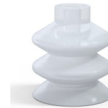
Référence déclinaison : 2 41SLT A