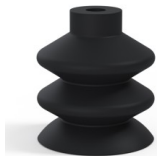
Référence déclinaison : 2 41NI A