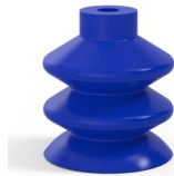
Référence déclinaison : 2 41PU A