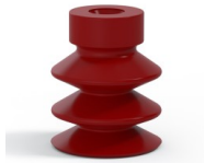
Référence déclinaison : 21 18SL A