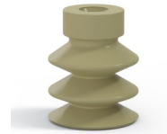
Référence déclinaison : 21 18CN A