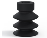
Référence déclinaison : 21 18NI A