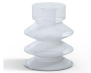
Référence déclinaison : 21 18SLT A