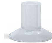
Référence déclinaison : 7 26SLT A