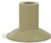
Référence déclinaison : 7 26CN A