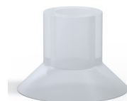
Référence déclinaison :