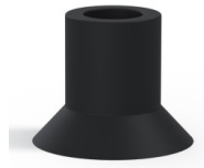
Référence déclinaison : 75 20NI A