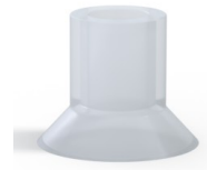
Référence déclinaison : 75 20SLT A