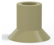
Référence déclinaison : 75 20CN A