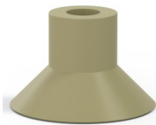
Référence déclinaison : 78 30CN A