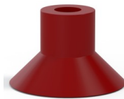
Référence déclinaison : 78 30SL/RV A