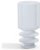
Référence déclinaison : 8 04SLT A