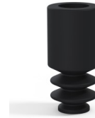
Référence déclinaison : 8 04NI A