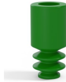
Référence déclinaison : 8 04SLV A