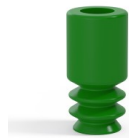
Référence déclinaison : 8 05SLV A