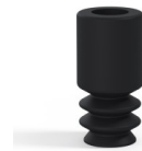
Référence déclinaison : 8 05NI A