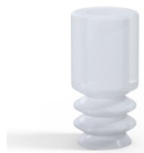
Référence déclinaison : 8 05SLT A