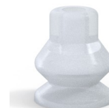
Référence déclinaison : 8 13SLT A