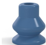
Référence déclinaison : 8 13SLBLEU A SH30