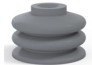
Référence déclinaison : 8 31.5NR A