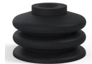
Référence déclinaison : 8 31.5NI A