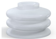
Référence déclinaison : 8 31.5SLT A