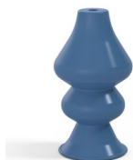
Référence déclinaison : 8 34SLBLEU A SH30