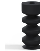
Référence déclinaison :