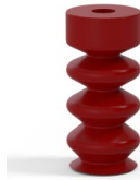
Référence déclinaison :