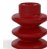
Référence déclinaison :