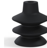
Référence déclinaison : 80A 36NI A