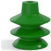
Référence déclinaison : 80A 36SLV A