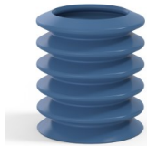
Référence déclinaison : 81 36SLBLEU A SH30