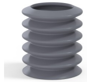
Référence déclinaison : 81 36SLDG A