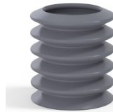
Référence déclinaison : 81 36SLDG A