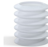
Référence déclinaison : 81 36SLT A SH40