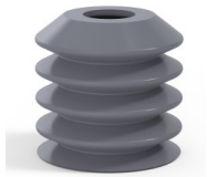
Référence déclinaison : 82 40SLDG A