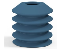
Référence déclinaison : 82 40SLDB A