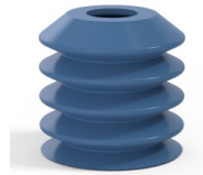
Référence déclinaison : 82 40SLBLEU A SH30