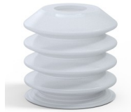
Référence déclinaison : 82 40SLT A SH40