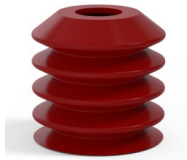
Référence déclinaison : 82 40SL A