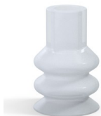
Référence déclinaison : 88A 30SLT A