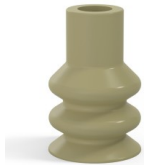
Référence déclinaison : 88A 30CN A