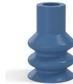
Référence déclinaison : 88A 30SLBLEU A