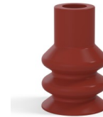
Référence déclinaison : 88A 30SLBRIQUE A