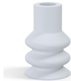
Référence déclinaison : 88A 30SLB A