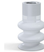
Référence déclinaison : 8B 30SLT F14 • Couleur: Translucide • Matière: Silicone