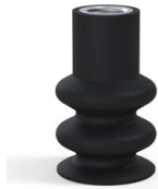
Référence déclinaison : 8B 30NI F14 • Couleur: Noir • Matière: Nitrile