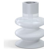
Référence déclinaison : 8B 40SLT F14