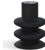
Référence déclinaison : 8B 40NI F14