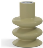
Référence déclinaison : 8B 40CN F14