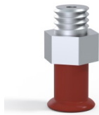
Référence déclinaison : 9 07SL M5M