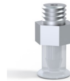
Référence déclinaison : 9 07SLT M5M