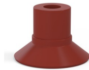
Référence déclinaison : 9 16SL A