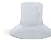
Référence déclinaison : 9 16SLT A