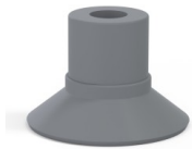
Référence déclinaison : 9 16NR A