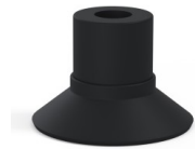
Référence déclinaison : 9 16NI A