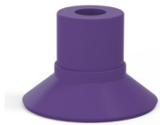
Référence déclinaison : 9 16MNT A