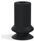
Référence déclinaison : 91 06NI A