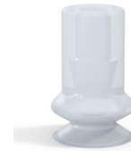
Référence déclinaison : 91 06SLT A