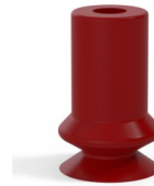
Référence déclinaison : 91 06SL A