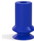
Référence déclinaison : 91 06PU A