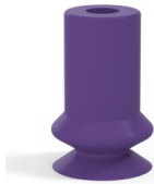
Référence déclinaison : 91 06MNT A