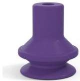
Référence déclinaison : 91 16MNT A