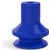
Référence déclinaison : 91 16PU A