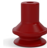
Référence déclinaison : 91 16SL A