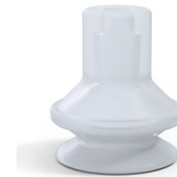
Référence déclinaison : 91 16SLT A