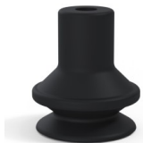
Référence déclinaison : 91 16NI A