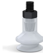
Référence déclinaison : 91 16SLT M5M