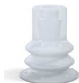
Référence déclinaison : 96 15SLT A