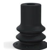
Référence déclinaison : 96 15NI A