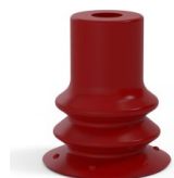
Référence déclinaison : 96 15SL A