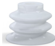
Référence déclinaison : 96 52SLT A