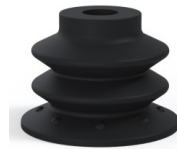
Référence déclinaison : 96 35NI M18D-4