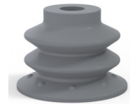
Référence déclinaison : 96 35NR M18D-4