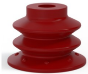
Référence déclinaison : 96 52SL A