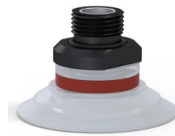
Référence déclinaison : 9 50SLT 38D-2-F