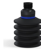
Référence déclinaison : 92 40NI 14D-2-GIC