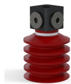
Référence déclinaison : 92 40SL 18D-3-BD