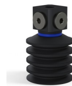
Référence déclinaison : 92 40NI 18D-3-BD