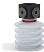
Référence déclinaison : 92 40SLT 18D-3-BD